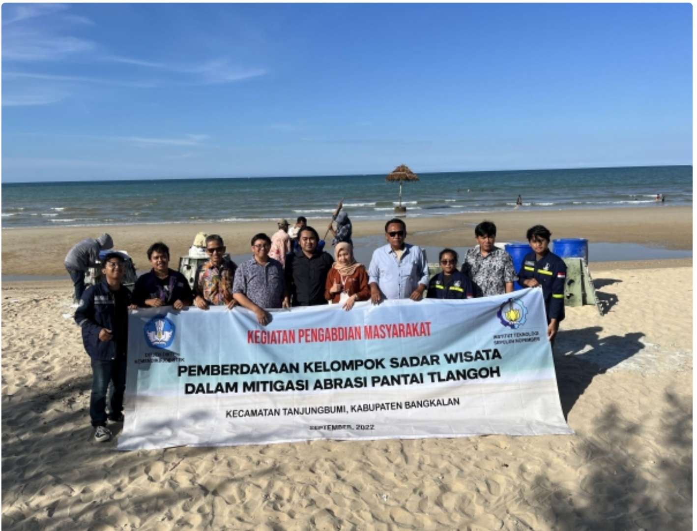
Tim KKN Abmas bersama dengan Kades Desa Tlangoh, Pokdarwis, dan Pertamina PHE WMO dalam kegiatan pemasangan Hexareef di Pantai Tlangoh

SURABAYA – Abrasi Pantai Tlangoh yang semakin memburuk beberapa tahun terakhir mengganggu perekonomian masyarakat sekitar. Berangkat dari masalah ini, Departemen Teknik Kelautan menggelar Pengabdian kepada Masyarakat (Abmas) merancang terumbu karang buatan di Desa Tlangoh, Madura.