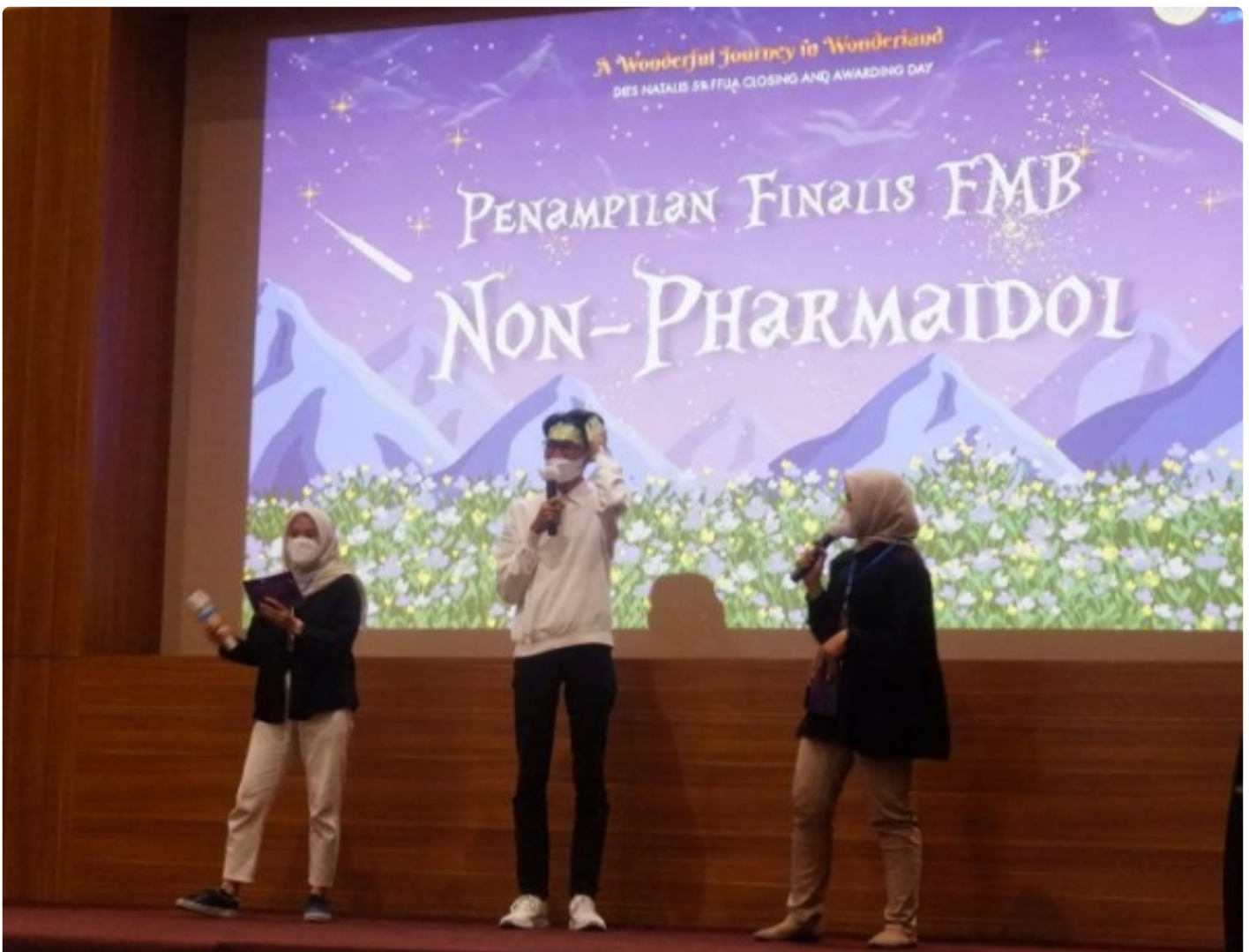
Ragam penampilan disuguhkan mahasiswa FFUA dalam penutupan Dies Natalis FFUA Ke-59.

SURABAYA – Puncak acara mahasiswa Dies Natalis Fakultas Farmasi Universitas Airlangga ke-59 dihelat pada Sabtu (24/9/2022) siang. Berbeda dari tahun 2021 yang diselenggarakan secara daring, penutupan tersebut