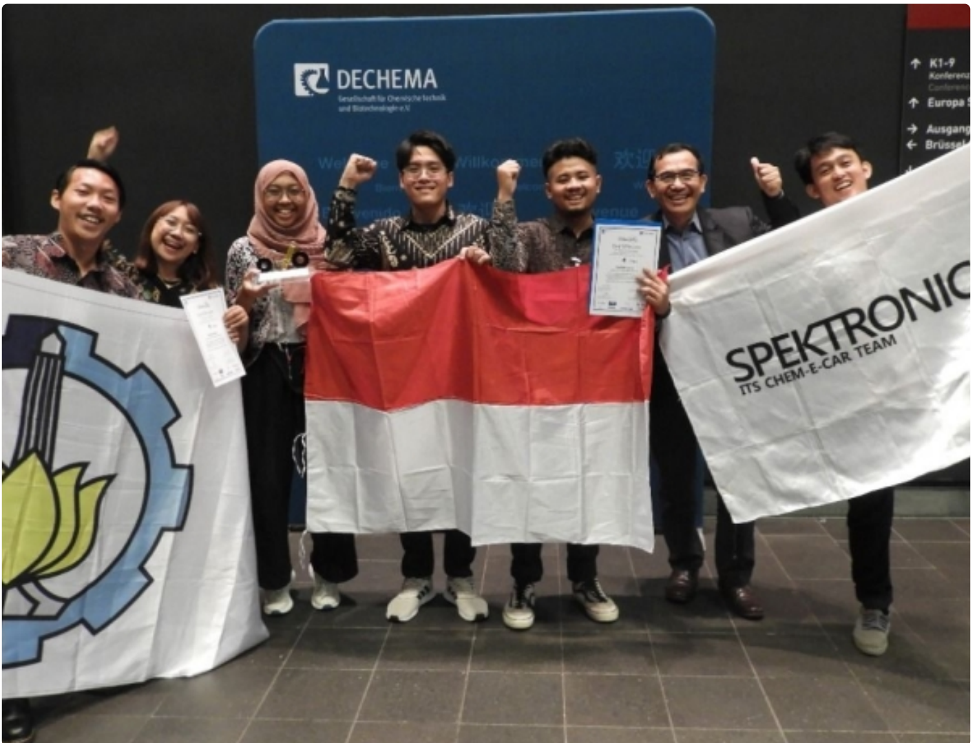
Tim Spektronics ITS Berjaya Jadi Juara Chem-E-Car di Jerman

SURABAYA – Mahasiswa Institut Teknologi Sepuluh Nopember (ITS) tak henti-hentinya menorehkan prestasi membanggakan internasional melalui bidang riset dan inovasi. Setelah tahun lalu berhasil meraih juara II, kali ini tim Spektronics ITS sukses menduduki podium di posisi pertama atau juara I pada ajang Chem-E-Car internasional bertajuk VDI ChemCar Competition 2022 yang diselenggarakan