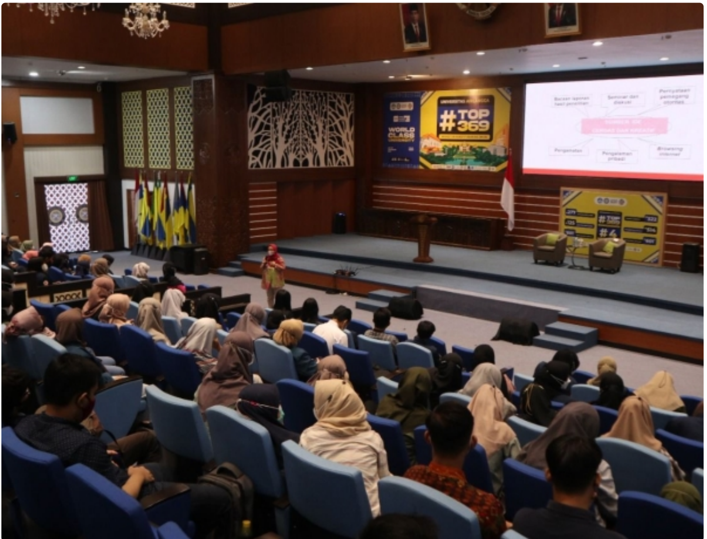
Pemberian tips dan trik sukses skripsi 2022.

SURABAYA – Mahasiswa semester tujuh merupakan mahasiswa semester akhir pada tahun pembelajaran saat ini. Pada masa seperti itulah biasanya mahasiswa semester tujuh kerap sibuk mengerjakan tugas akhir atau skripsi sebelum sampai pada tahap wisuda. Namun, tak jarang terdapat kendala dalam proses pengerjaan skripsi.